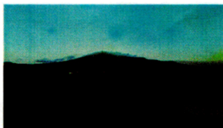
北、元旦の安達太良連峰、山頂には雲