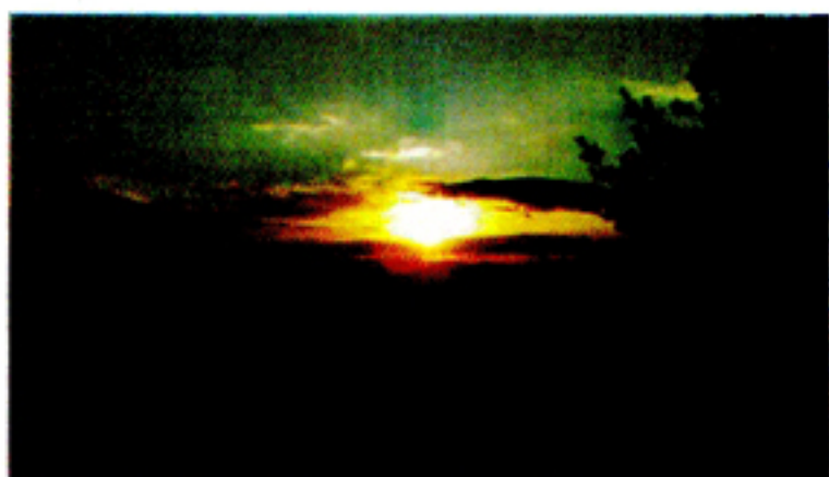
東南、大滝根山上から登る初日の出